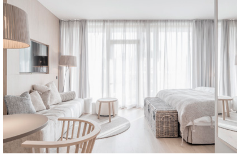
Ankommen und wohlfühlen: Die 63 Zimmer und Suiten sind hochwertig und mit Liebe zum Detail ausgestattet.