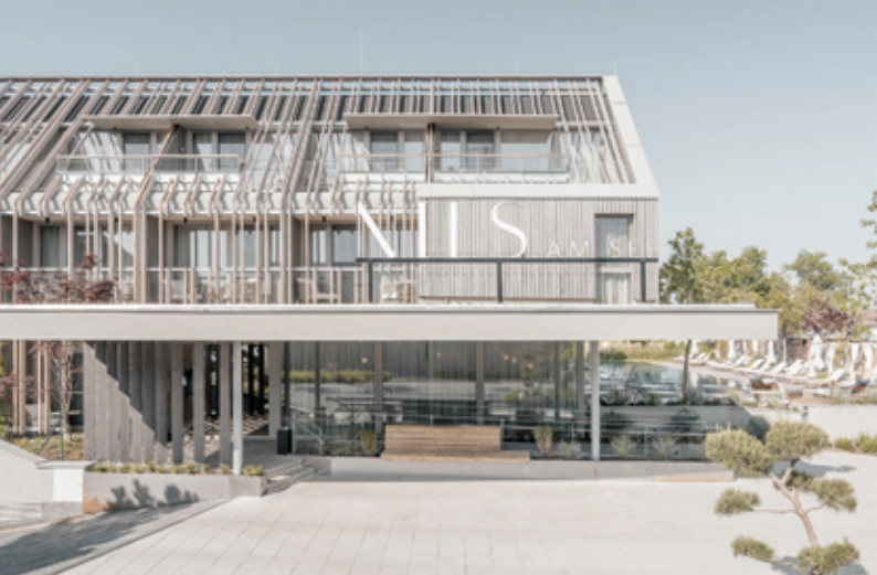
Hotel mit Strandhaus-Feeling: Gelegen am malerischen Ufer des Neusiedler Sees steht das „Nils am See“ für eine neue Generation nachhaltiger Hotellerie.