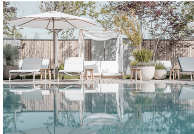
Auch die Pool-Landschaft des „Nils am See“ überzeugt durch die hochwertige Gestaltung und Ausstattung.

Details wie z. B. thematisch passende, hochwertige Kunstwerke der Wiener Künstlerin Charlotte Klobassa tragen zur außergewöhnlichen Atmosphäre des Hotels bei.